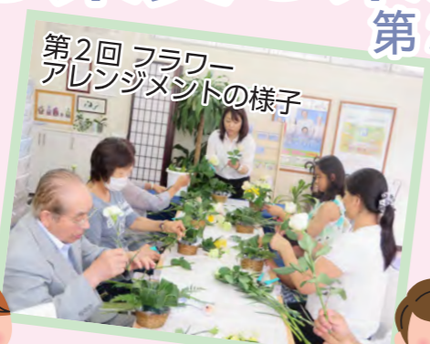
第2回 フラワーアレンジメントの様子