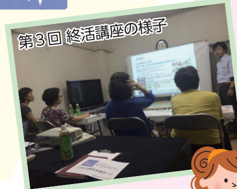
第3回 終活講座の様子